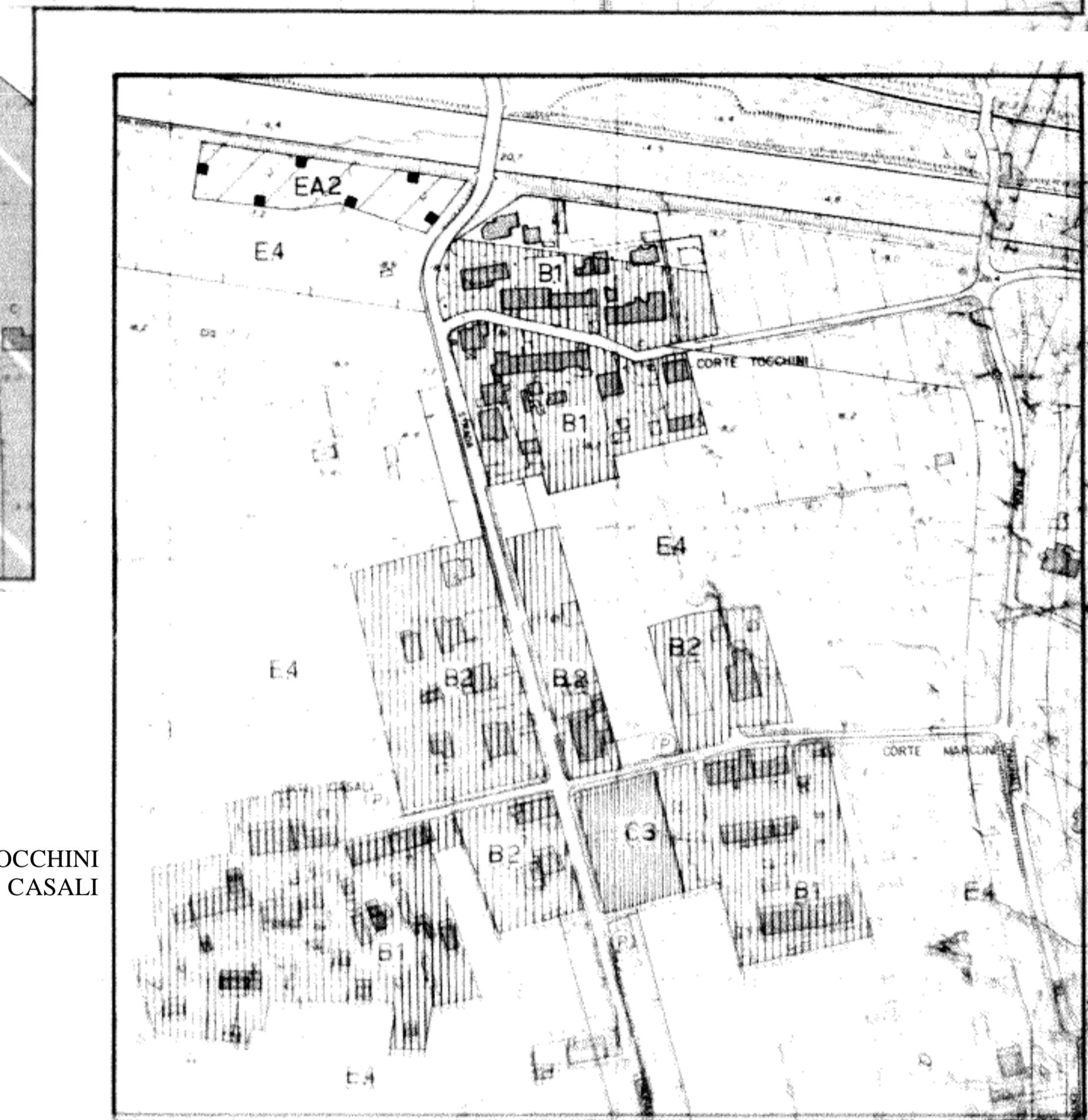
CORTE TOCCHINI CORTE CASALI